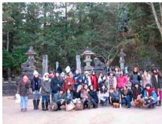
国際交流研修旅行