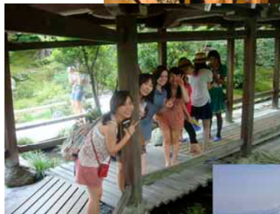
京都・奈良見学旅行の様子