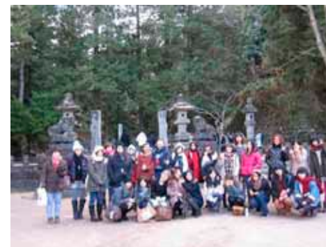
International Exchange Study Trip