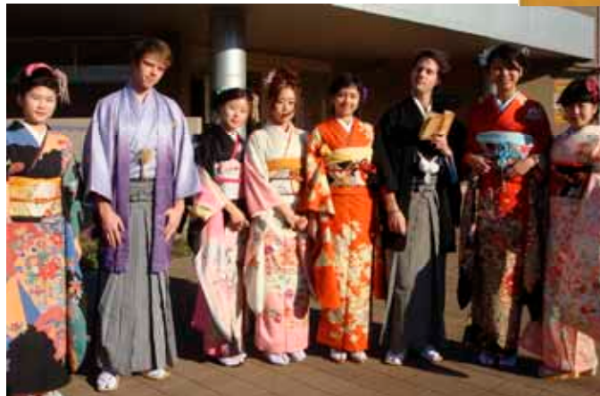
Japanese cultural experience