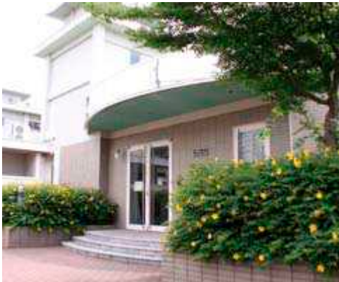
International Student House

Japanese undergraduate students and international students can live here.