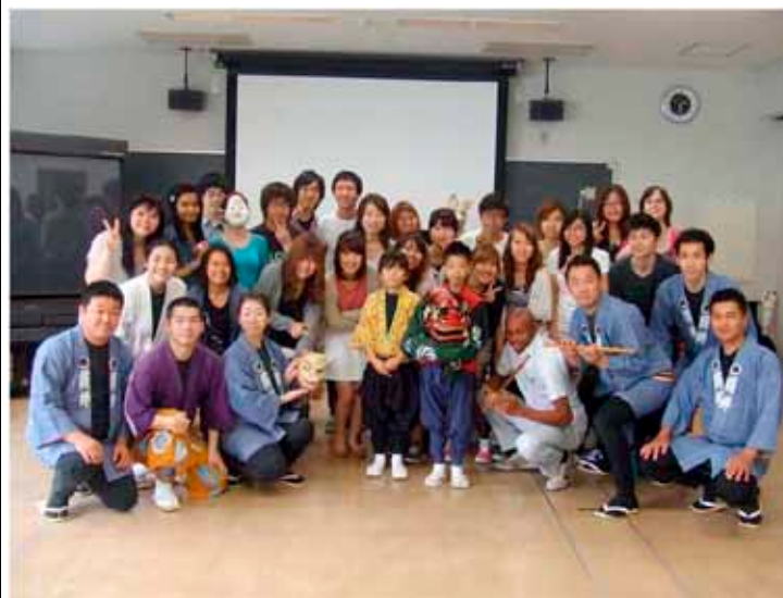
貫井囃子（ぬくいばやし）ワークショップ

小金井市は1958年10月に、東京都で10番目の市として誕生しました。都心から25kmという位置にあり、人口10万あまりの緑ゆたかで快適な生活のできる町です。