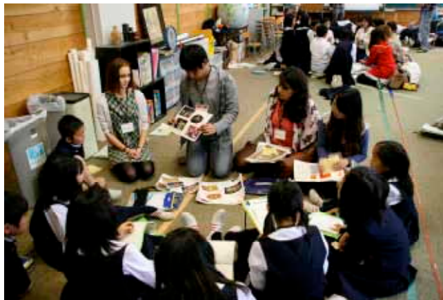
附属小学校で交流授業

また、中国（北京）、韓国（ソウル）、タイ（バンコク）にて、修了生同窓会を開催しました。