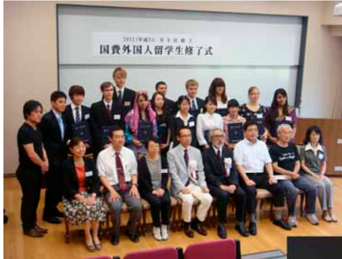
2011 Japanese Studies students