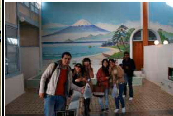
Visiting Edo-Tokyo Open Air Architectural Museum

http://www.u-gakugei.ac.jp/~gisec/program01/index.html