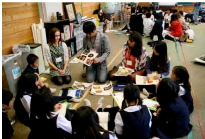
Cultural exchange at the affiliated primary school

In addition, alumni reunion was held in China (Beijing), Korea (Seoul) and Thailand (Bangkok).