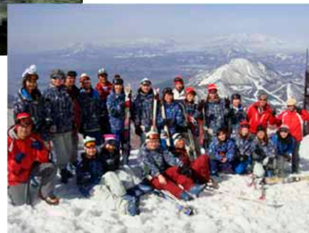
スキー講習会の様子