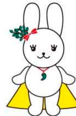
College Mascot : Kokupyon

International Exchange Programs Office on Kokugakuin University Website http://www.kokugakuin.ac.jp/intl/index.html